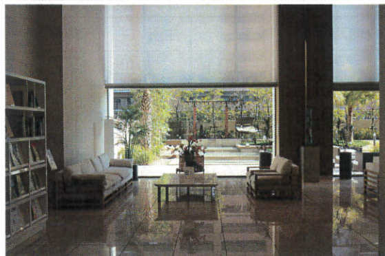
総戸数185戸のお洒落なタワー ホテルライクなエントランスロビー